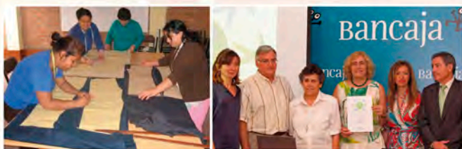
Acto de entrega a la ONG-ACESVAL de 8.800 euros por BANCAJA, para UN TALLER DE CORTE Y CONFECCIÓN en Ibague, Colombia